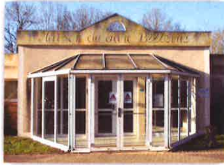
La Maison du Parc