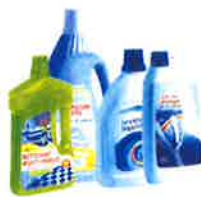
Flacons de produits ménagers...