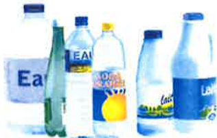
Bouteilles d'eau, de jus de fruit, de soda, de lait, de soupe...