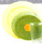
Plats en plastique